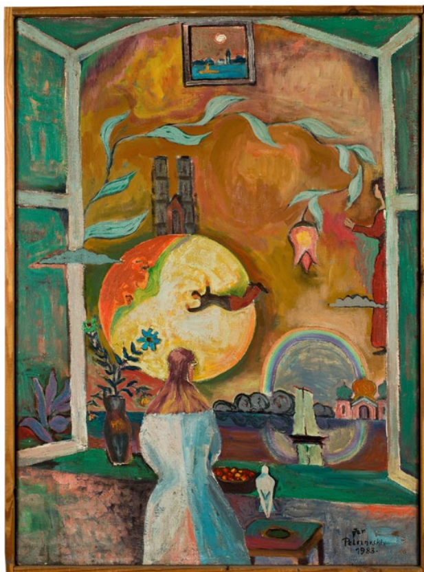
Jan Pelczarski, Marzenie, 1983 Reprodukcję tego obrazu, który znajduje się w kolekcji Muzeum Narodowego we Wrocławiu, możecie zobaczyć w książkowym kalendarzu na 2021 rok wydanym przez Muzeum.

Czy widzisz, jak na księżycostoiu stoi nasza wrocławska katedra?